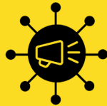
Created by MiNo